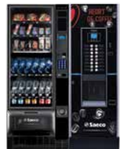
Artico S + Cristallo Evo 400